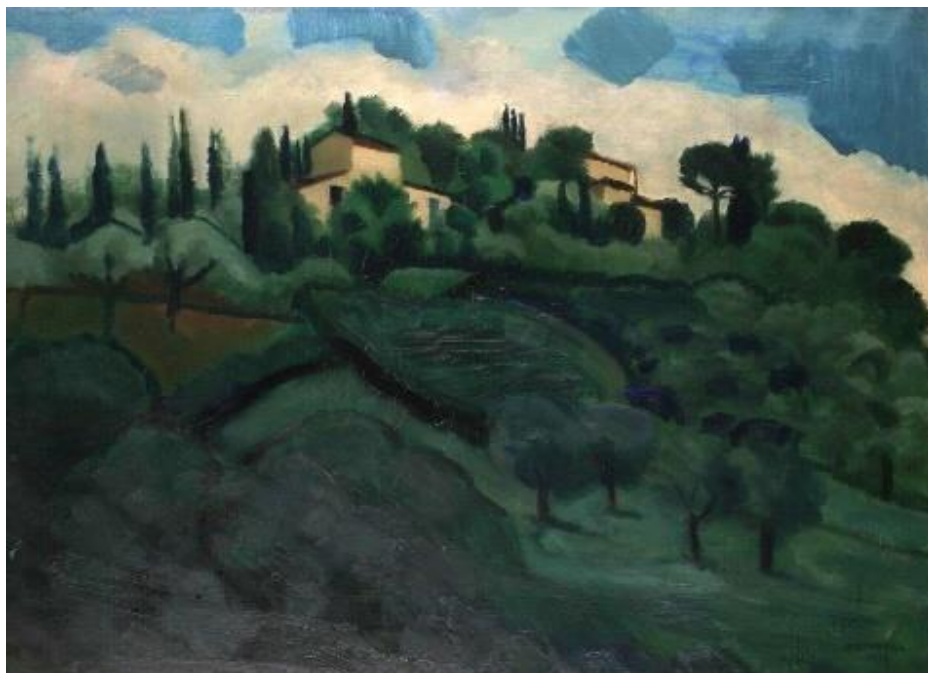
Rudolf Kremlička, Vily u Florencie , 1927