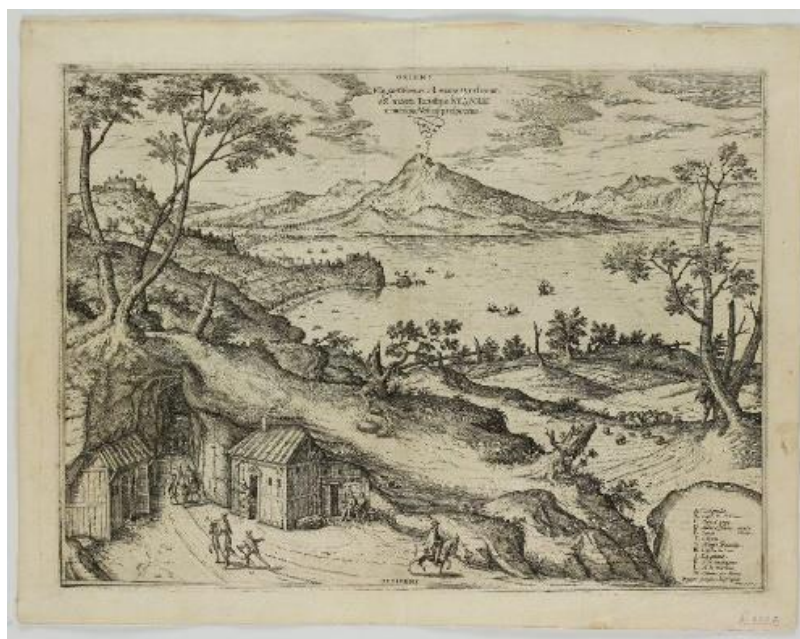
Joris Hoefnagel, Pohled na Neapol, 1578